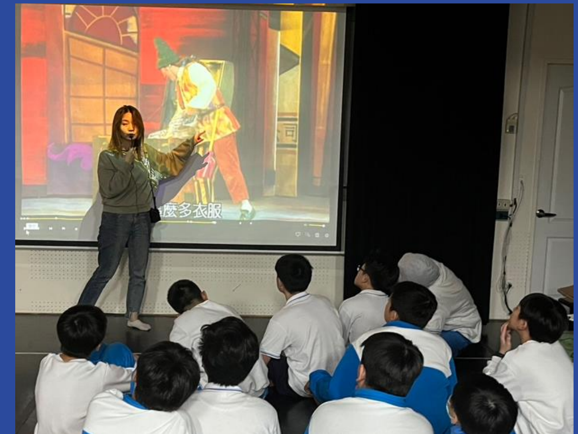
七年級表演藝術 戲劇角色中的性別印象