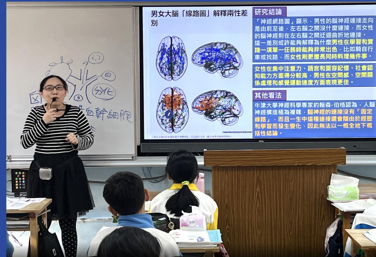
七年級生物 男女大腦大不同？