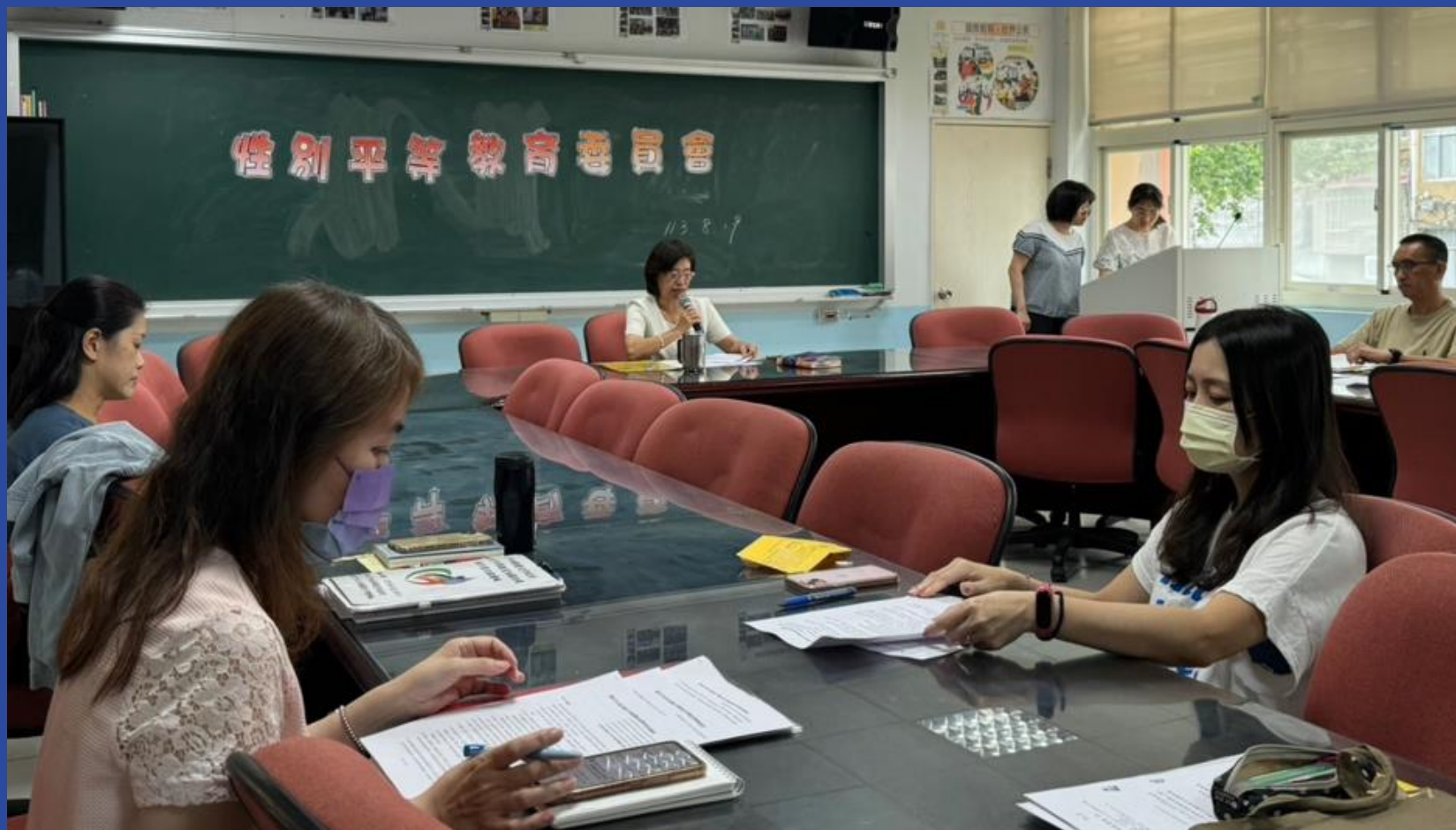
討論校內性別平等教育法規