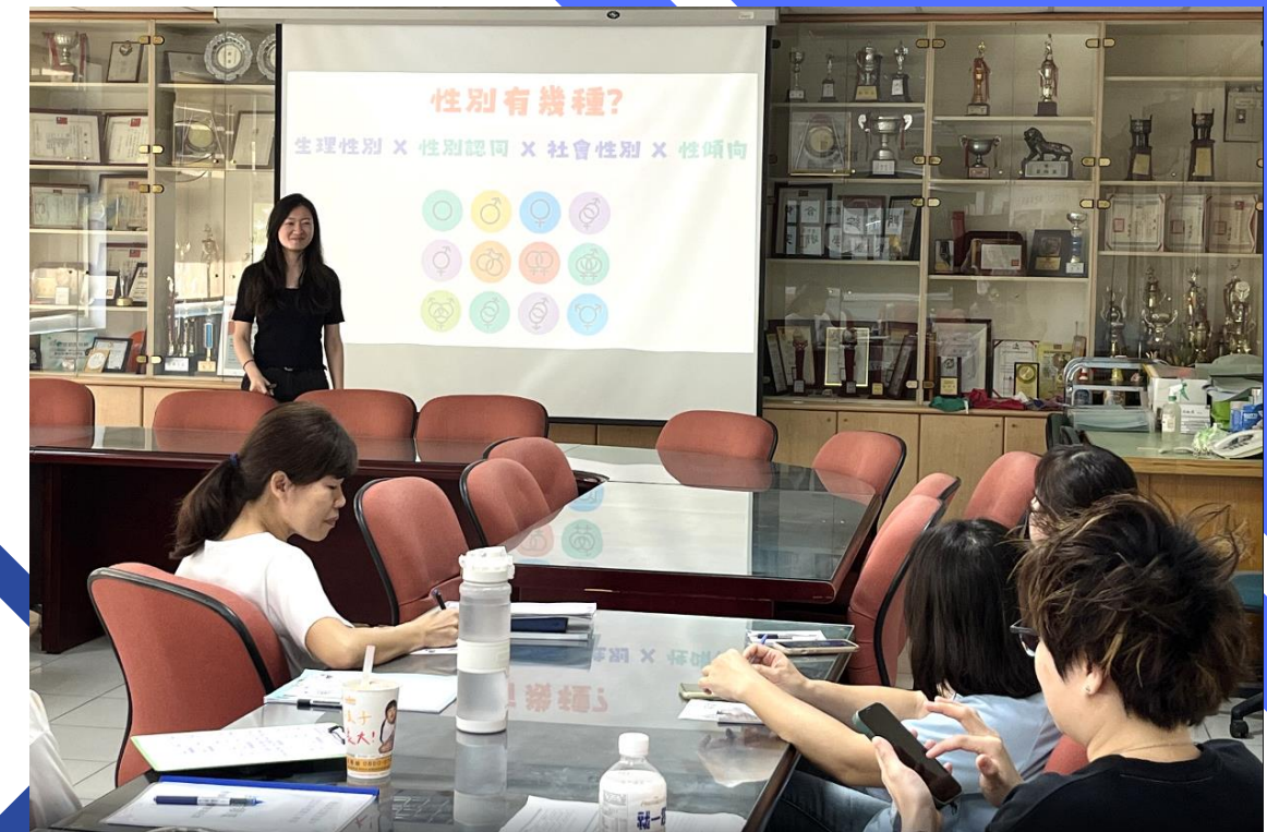
12月期中教研「多元性別」研習