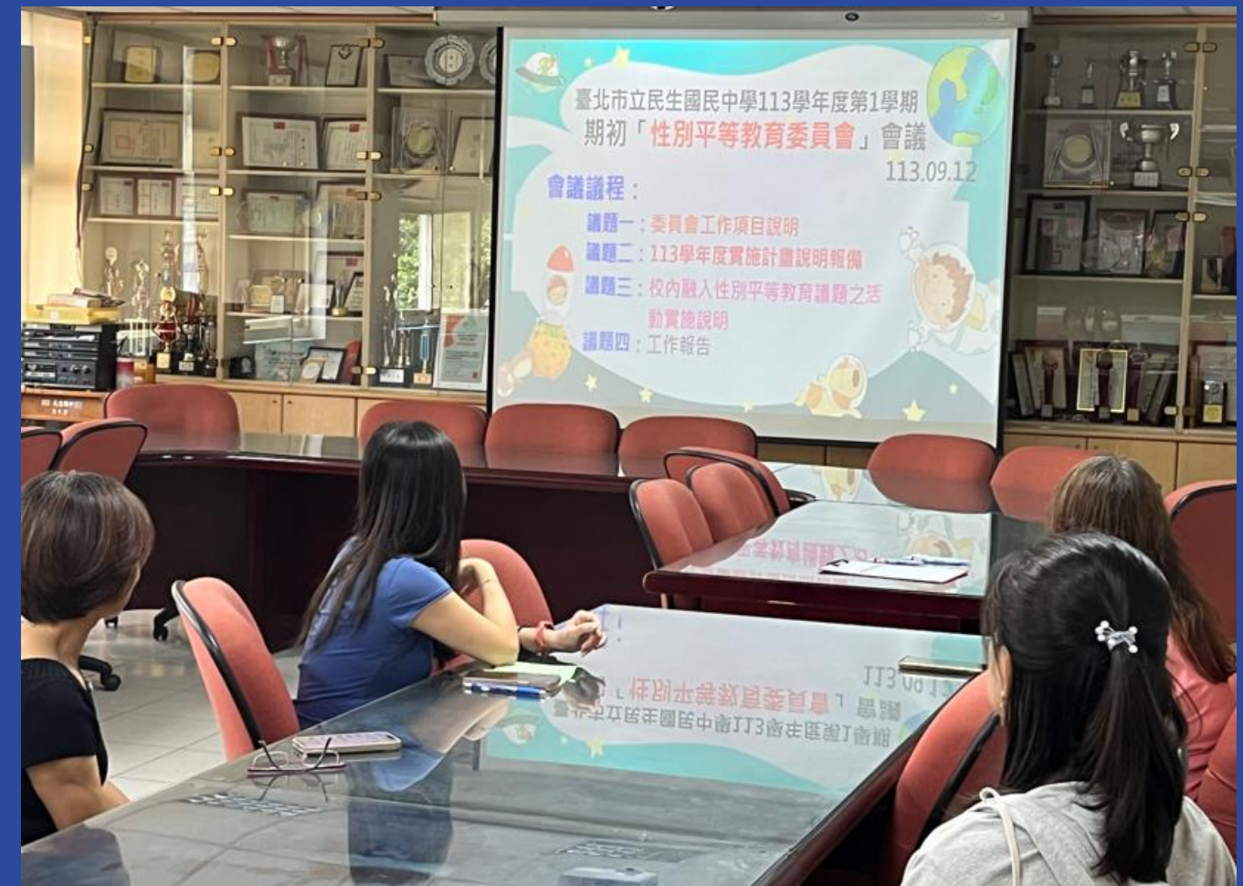
期初性別平等教育委員會