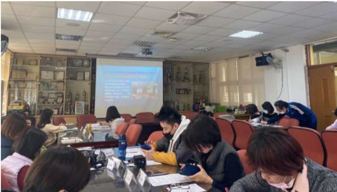
校內實施性別平等教育課程之教材審議說明