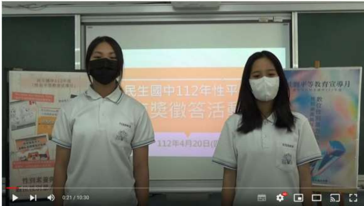
由學生擔任抽獎活動的主持人