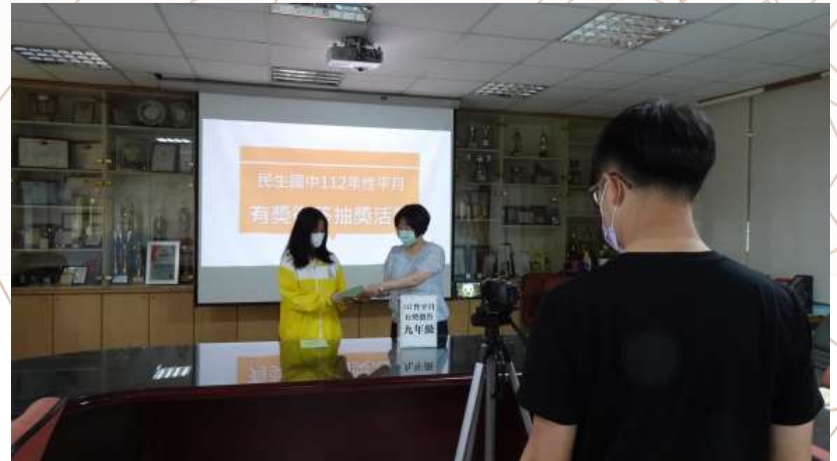
於簡報室公開抽獎並錄製影片