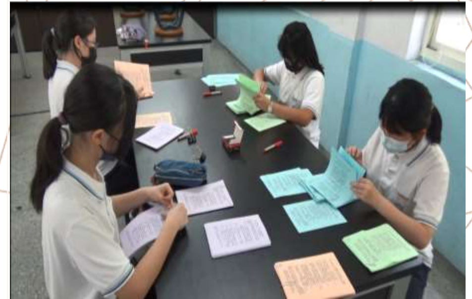
輔導股長協助批閱檢查有獎徵答單