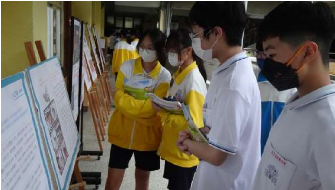
學生觀看海報展示內容

藉由海報展示常見的數位性別暴力樣態提升數位安全的素養，協助師生保障自己與他人的權益。