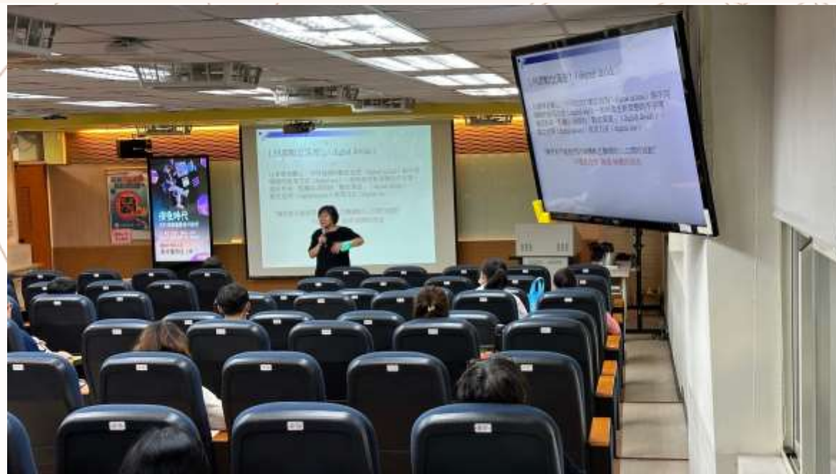
05.31 邀請嚴祥鸞教授主講 北市健體領域老師參加