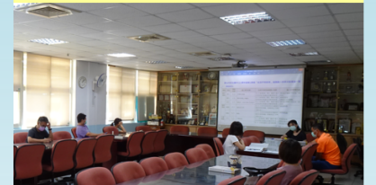
性平教育議題融入各領域課程計畫、融入彈性課程說明

111-1性平教育議題融入教學活動一覽表 已於9月22日111-1期初性別平等委員會議 說明報備