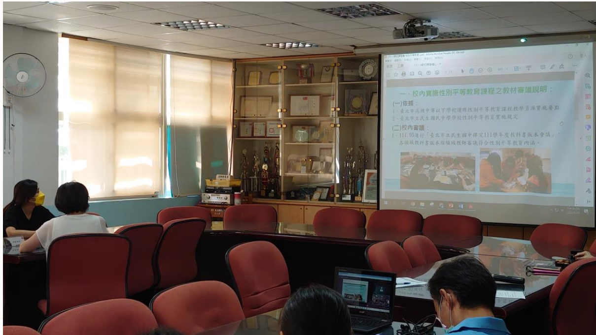
校內實施性別平等教育課程之教材審議說明